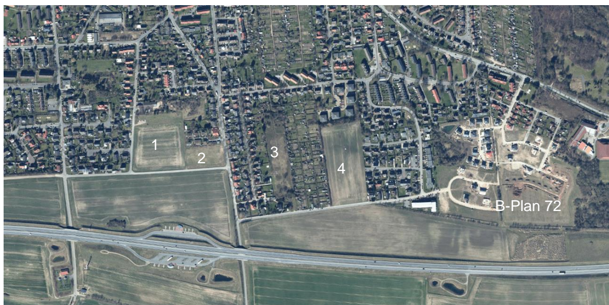
Abb.: DA Nord

In der Stadt Heiligenhafen besteht trotz des sich abzeichnenden demographischen Wandels aufgrund der wachsenden Einwohnerzahlen ein großer Bedarf an Bauland. Der gewählte Standort folgt den Darlegungen der Regionalplanung 2004 für künftige Wohnbauentwicklungen im Süden und Westen und entwickelt sich aus Landschaftsplan und Flächennutzungsplan. Innenentwicklungspotenziale nennenswerten Umfangs stehen nicht zur Verfügung. Die Stadt betreibt bereits eine Vielzahl von Bauleitplanungen mit dem Ziel der Nachverdichtung. Im östlich gelegenen Geltungsbereich des Bebauungsplanes Nr. 72 sind nahezu alle Grundstücke veräußert und größtenteils bebaut (Das Luftbild gibt hier nicht den aktuellen Stand wieder).