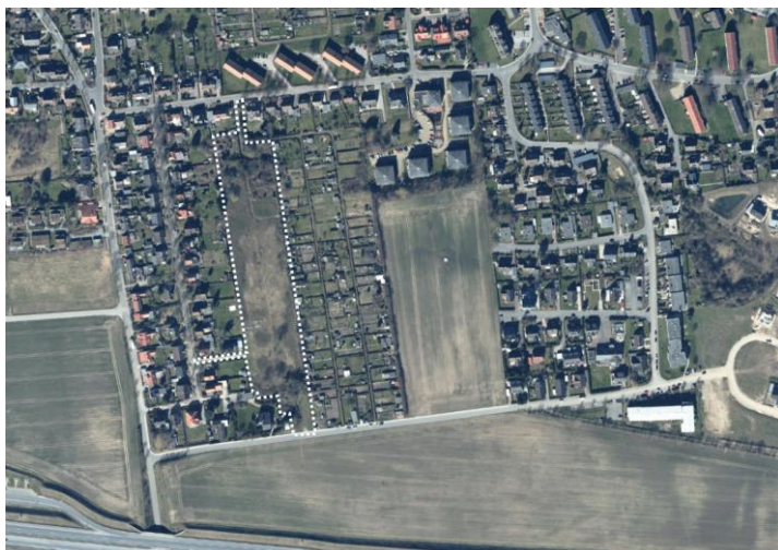
Abb.: DA Nord

Das Plangebiet liegt im Süden der Ortslage östlich der Bebauung Lindenstraße, südlich der Bebauung Am Lindenhof, westlich der vorhandenen Kleingärten und umfasst diverse Flurstücke der Flur 16, Gemarkung Heiligenhafen. Die Fläche präsentiert sich als Siedlungsbrache mit vereinzelt Bäumen im Norden und im Süden. Das Gelände ist stark bewegt und fällt nach Norden deutlich ab. Westlich und nördlich des Plangebietes befindet sich die bebaute Ortslage; direkt östlich grenzen Kleingärten an, weiter östlich ist wiederum Wohnbebauung vorhanden. Die Fläche südlich des Plangebietes zwischen Carl-Maria-von-Weber-Straße und Autobahn wird landwirtschaftlich genutzt.